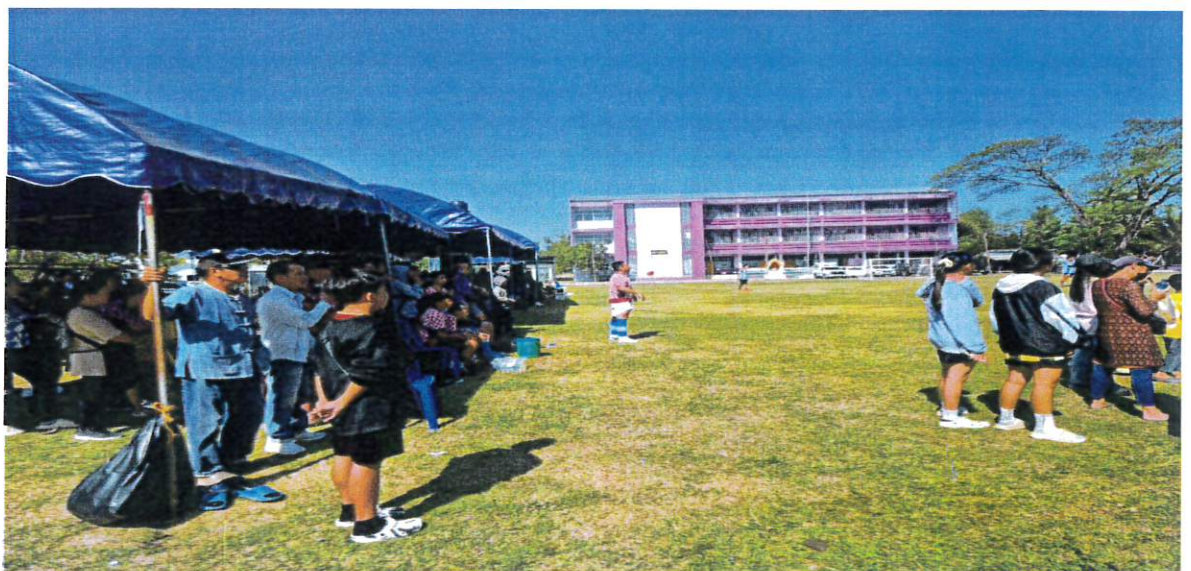
ลานาถูกตอง