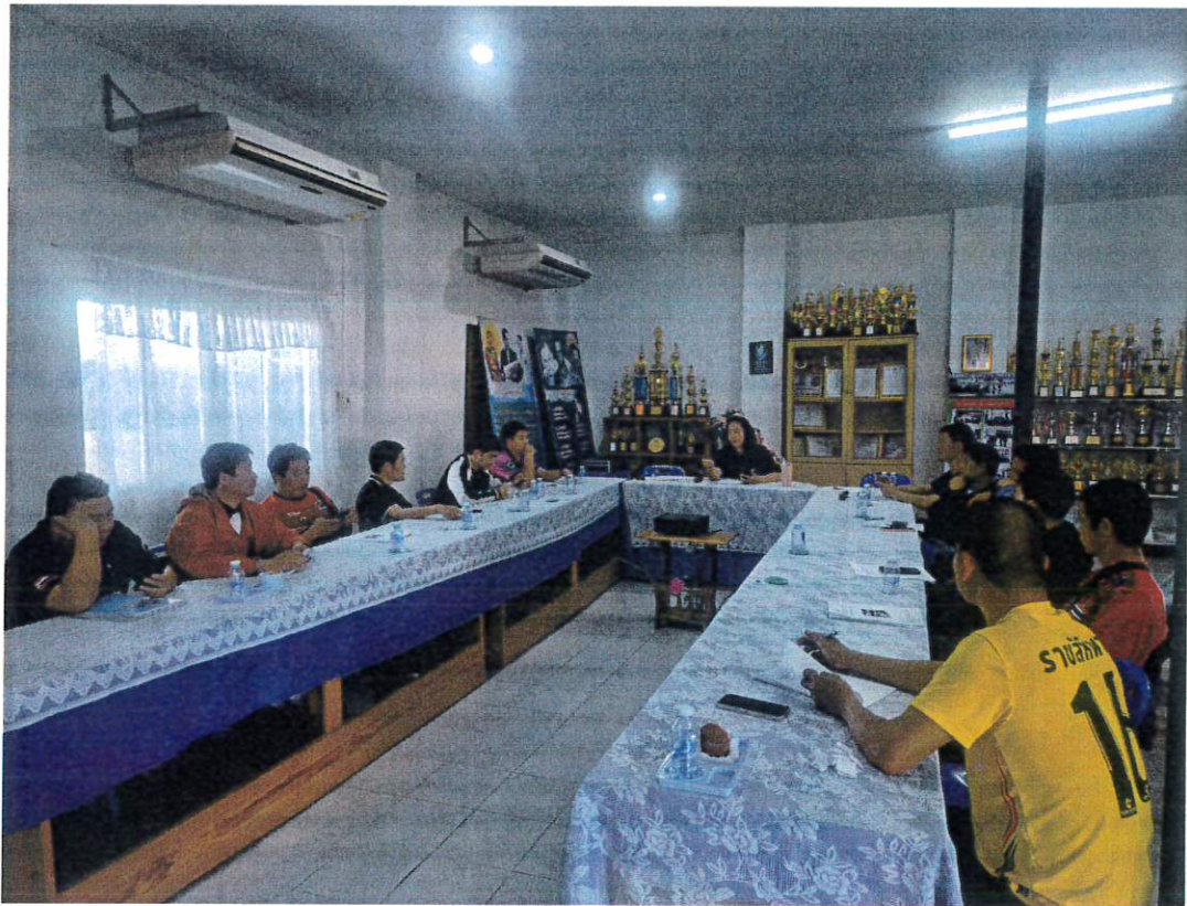
ภาพถ่ายผู้เข้าร่วมประชุมโครงการแข่งขันกีฬาด้านยาเสพติด ประจำปี ๒๕๖๙