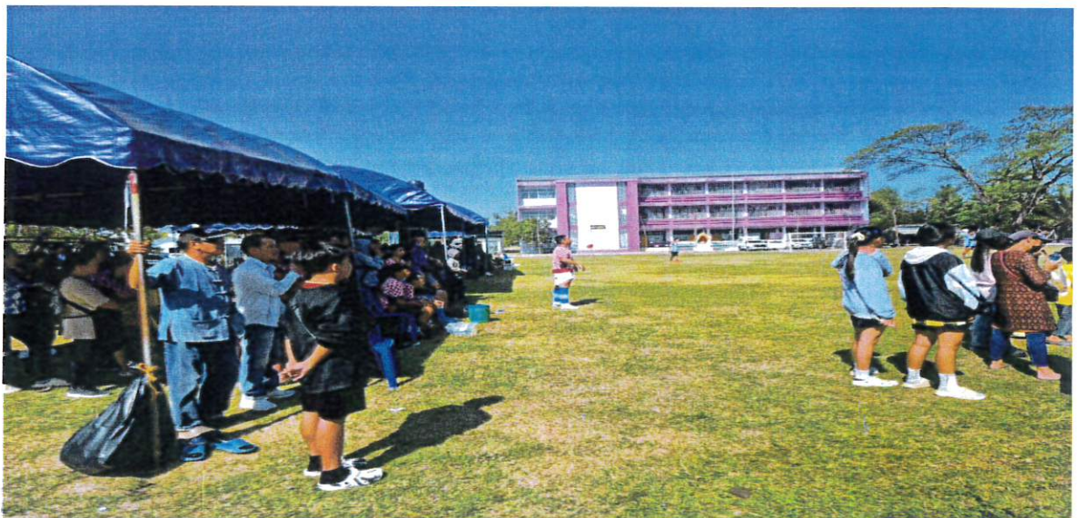
ลานาถูกตอง